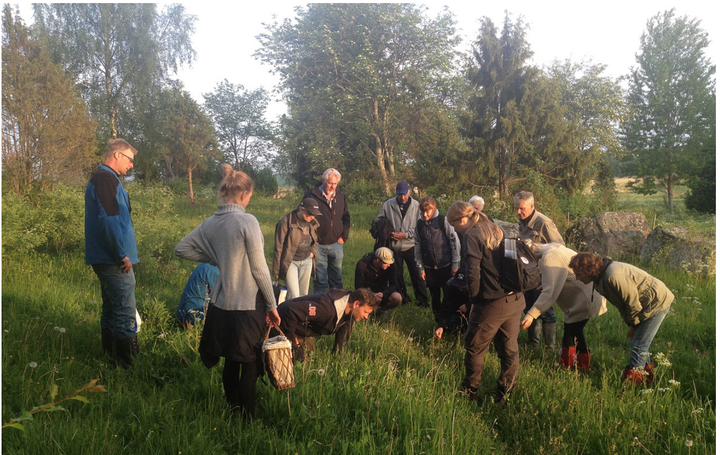
Fältvandring i Natura 2000-område i Väsby.