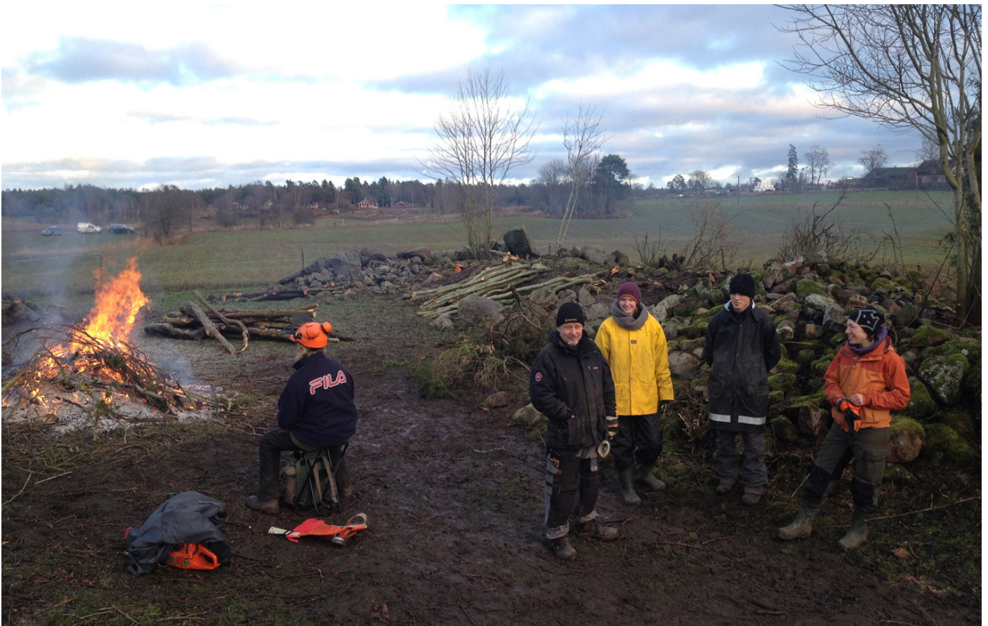
Praktisk naturvård i Senneby.