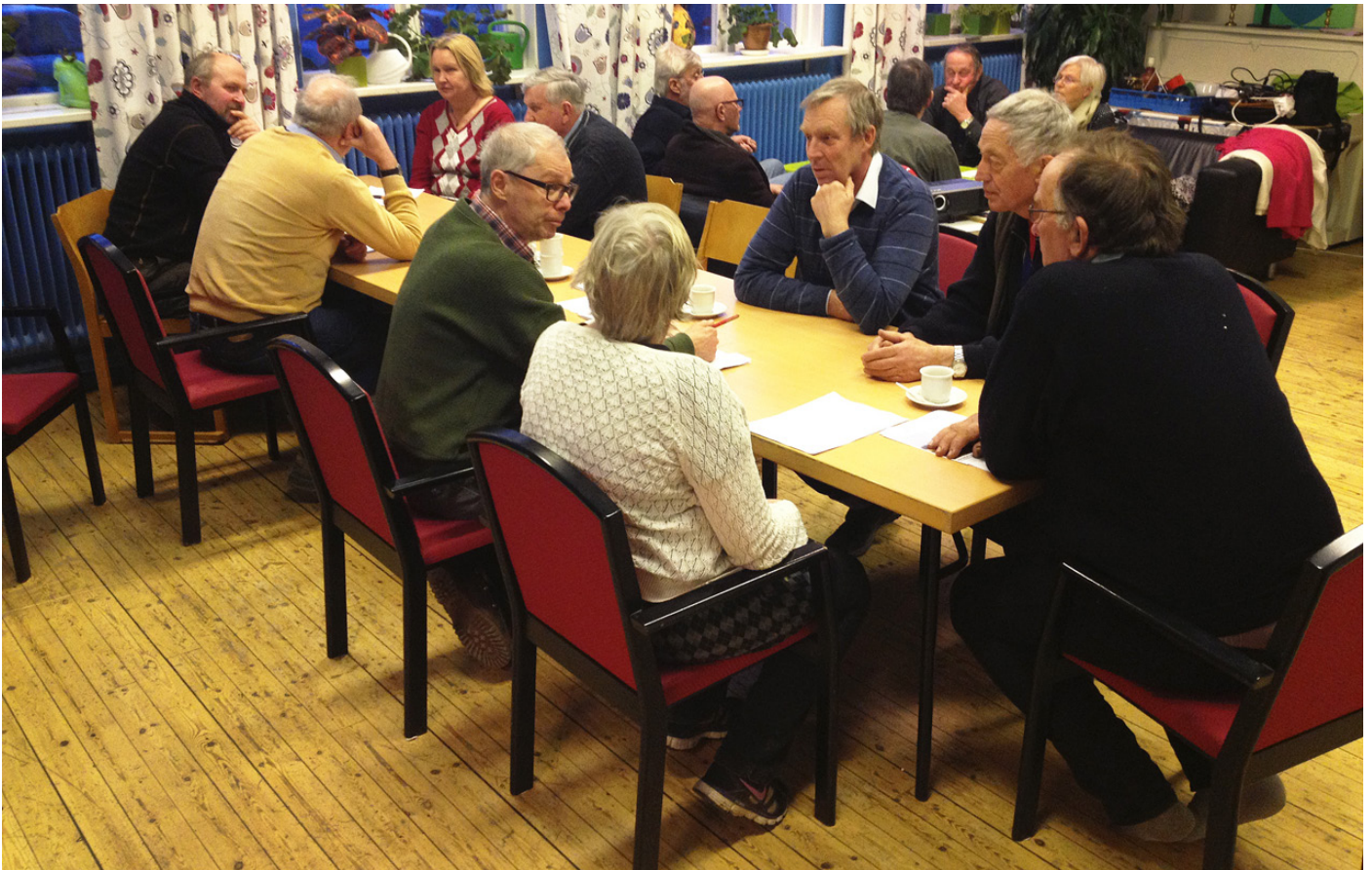
Upptagsmöte för trakten Norr- och Söderhenninge.