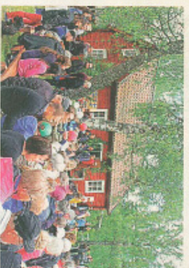
FOLKFEST. Firandet på hushållsgården i Hågerudd lockade många.