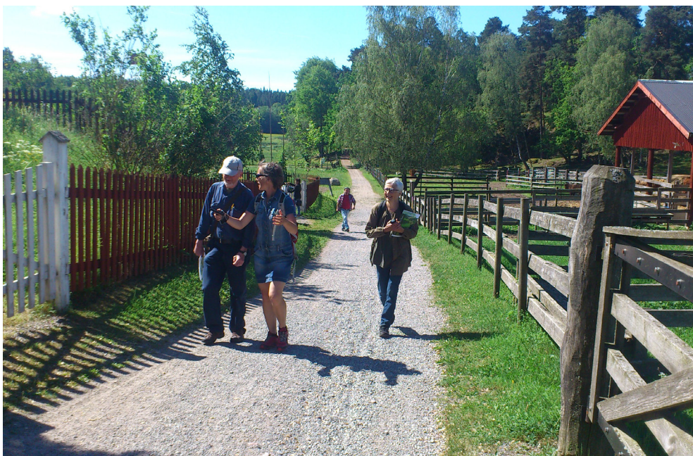
Styrelse och personal på Bögsgård i juni.

Studiebesök med NNS styrelse och personal på Bögsgård i juni.