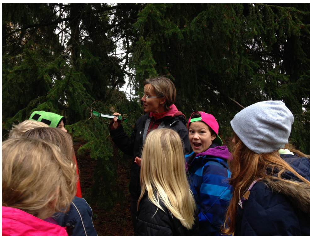
Björn-pejling med elever.

Ett av årets större projekt har varit ”Rovdjursinformation i Roslagen” (Länsstyrelsen i Stockholms Län). Färsna Naturcentrum har erbjudit 15 rovdjursdagar för elever på Färsna gård. Innehållet har varit kunskap om de stora rovdjuren och olika aktiviteter kring rovdjur. Fokus har legat på diskussion, dialog och att träna sig på att ta egen ställning. Färsna Naturcentrum har också byggt upp en enkel Rovdjursutställning på Färsna gård med skinn, skallar, bilder mm. Projektet har skett i samarbete med Rovdjurscentrat De 5 stora i Järvsö och Länsstyrelsen i Stockholms län. Finansiering har skett av Länsstyrelsen i Stockholms län. 300 elever har fått ta del av rovdjursdagarna under 2014. Projektet slutrapporterades i december 2014. Det är nu femte året i rad som Färsna Naturcentrum kunnat erbjuda rovdjursdagar för elever. Färsna Naturcentrum kommer att ha tema rovdjur som en ordinarie del i verksamheten framöver.