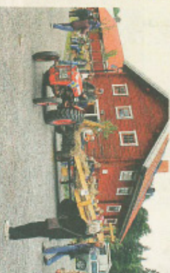
TRAKTORSKURSER. Många barn ville åka med traktor och vagn som anordnades av Vågar Aktörsklubben.