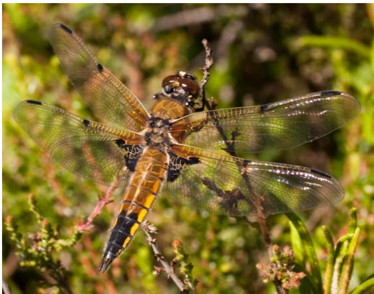
Figur 7. Runt sjöträsket observerades ett stort antal fyrfläckad trollslända.

I sjöträsket observerades ruda. Runt träsket växte rikligt med tranbär vilka besöktes av massor av humlor. Stranden patrullerades även av ett stort antal fyrfläckad trollslända (Figur 7).