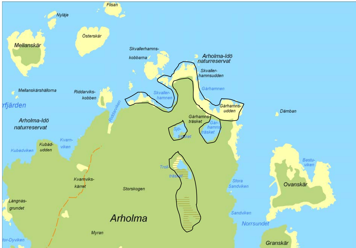
Figur 5. Områden innanför svarta linjer inventerades vid ett tillfälle.

Inget fynd av gölgroda gjordes. På norra delen av Arholma finns tre stora vatten som antogs kunna fungera som leklokaler för gölgroda (Figur 5). Det finns även några kustnära mindre hållkar.