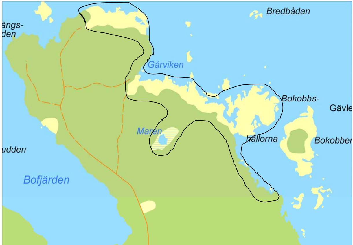
Figur 1. Området innanför den svarta linjen inventerades vid fyra tillfällen.

Området (Figur 1) besöktes 2009-05-25, 2009-05-31, 2009-06-16, 2009-08-21. Vid besöket 2009-05-31 deltog även Nils Ljunggren i inventeringen.