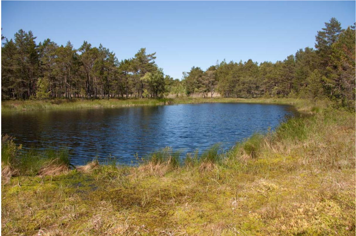
Figur 8. Den södra delen av Trollträsket ses på bilden. I eller runt träsket påträffades inga groddjur.