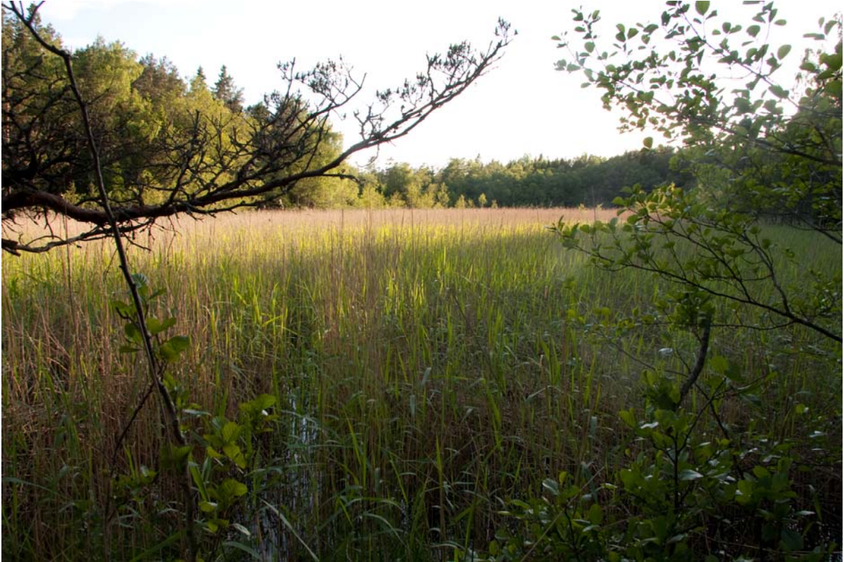
Figur 4. Kärret vid Östanvik var vid besöket i stort sett helt igenväxt.