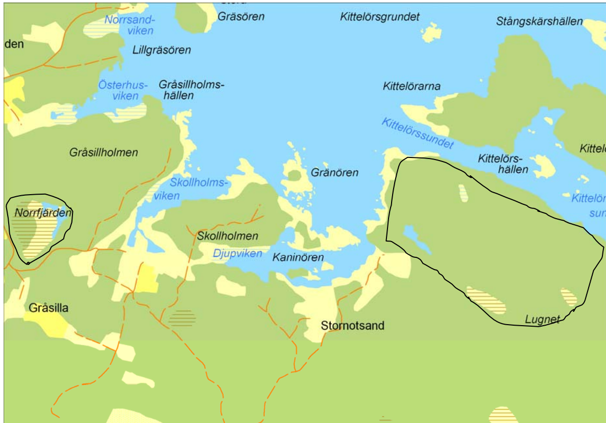
Figur 9. Områden innanför svarta linjer inventerades vid fyra tillfällen.

De områden som inventerades var kärren som ligger på udden öster om Stornotsand och Norrfjärden (Figur 9).