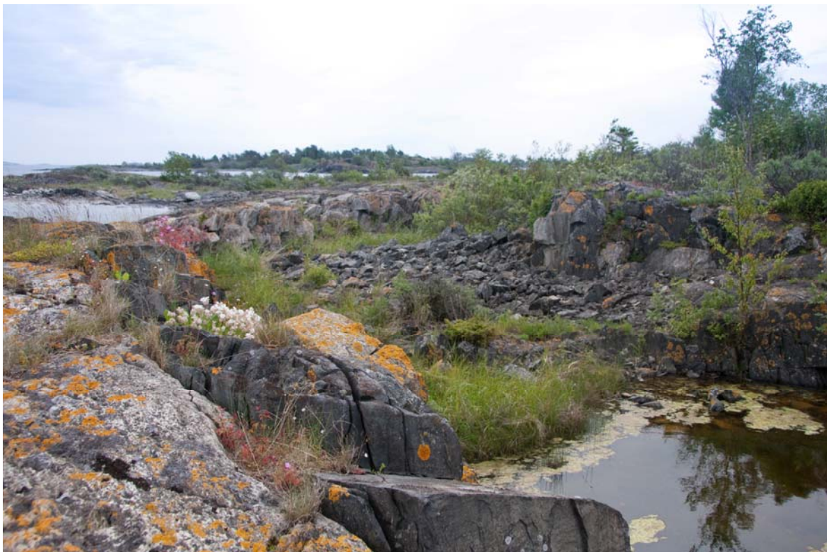
Figur 15. På ön Viten har det tidigare brutits sten vilket skapat några fina vatten som bör gynna groddjur. De stora mängder sten som finns runt vattnen utgör lämpliga daggömslen.

En större vattensalamander och två mindre vattensalamandrar observerades.