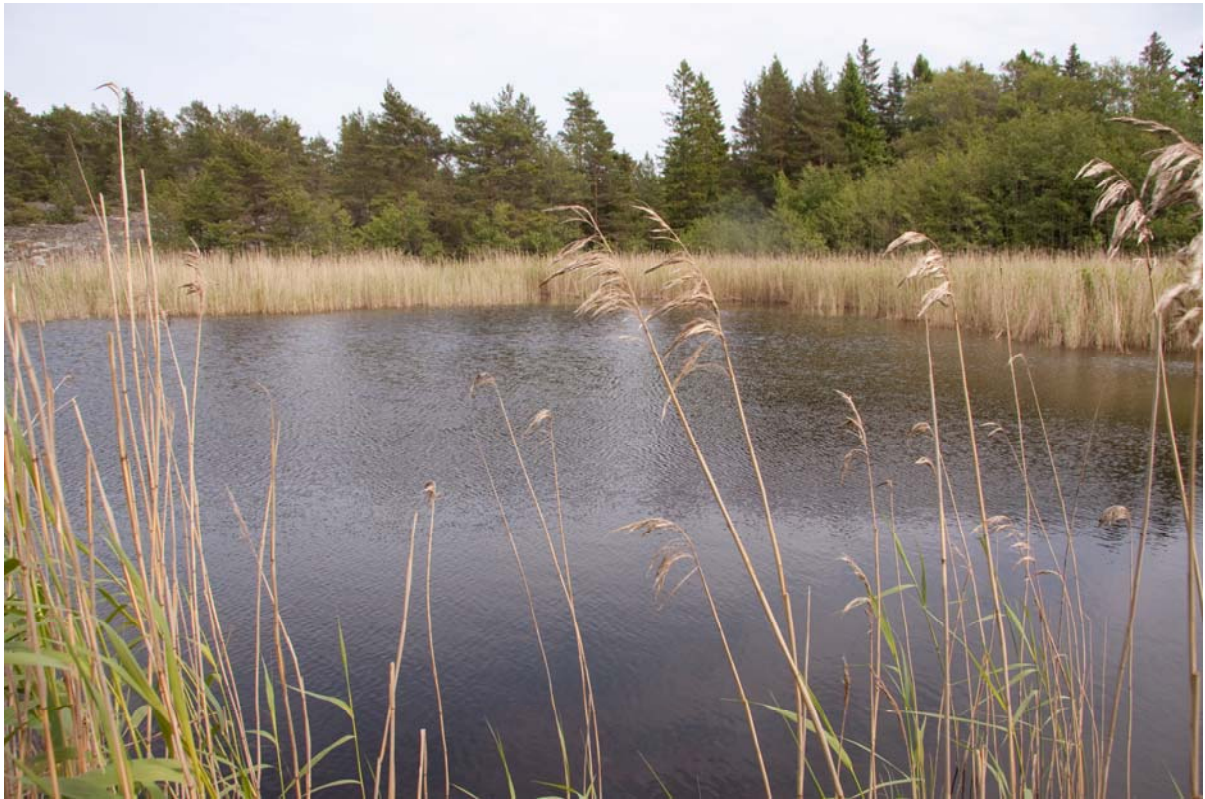
Figur 13. Det västra kärret är närmast att betrakta som en glosjö som sannolikt kan ha kontakt med havet vid hårt väder. Rikligt med yngel från vanlig padda påträffades.