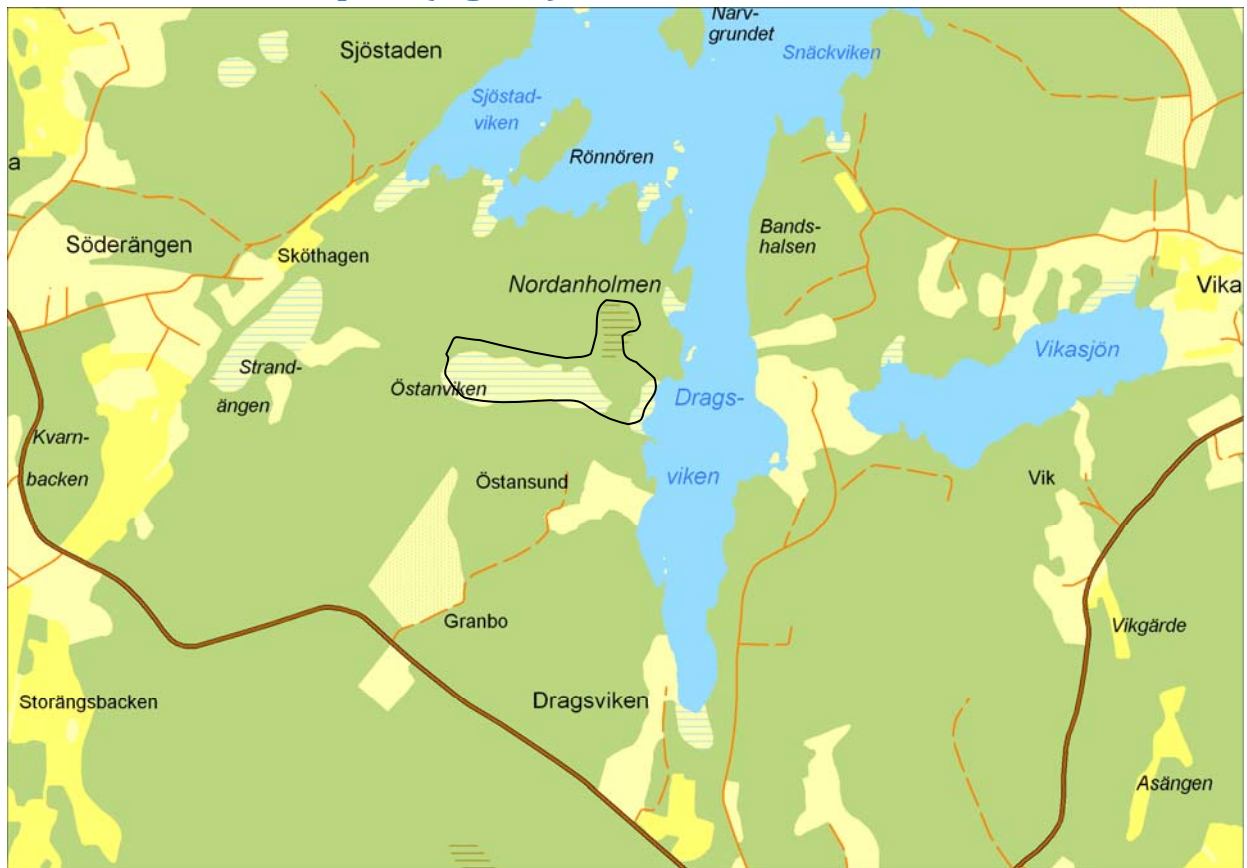
Figur 3. Området innanför den svarta linjen inventerades vid ett tillfälle.