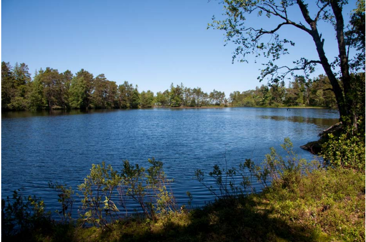
Figur 6. Gårdhamsträsk var det största vattnet på Arholma. Stora mängder av yngel från vanlig padda liksom tre melanistiska snokar.

I sjöträsket observerades ruda. Runt träsket växte rikligt med tranbär vilka besöktes av massor av humlor. Stranden patrullerades även av ett stort antal fyrfläckad trollslända (Figur 7).