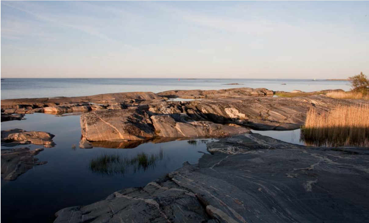
Figur 2. På udden i norra delen av det inventerade området finns ett flertal hällkar som utgör möjliga leklokaler för gölgroda. I detta kluster av hällkar påträffas två gölgrodor 1989.