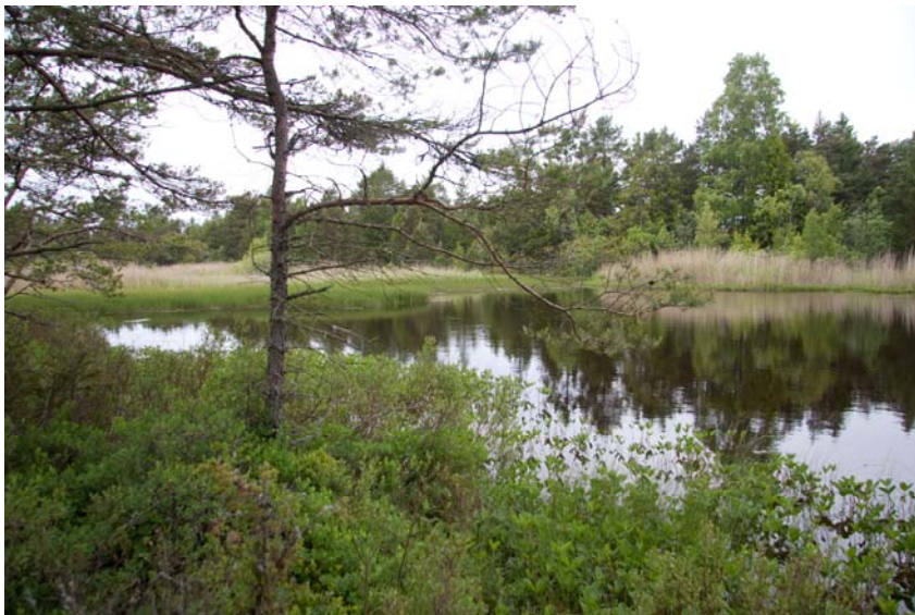
Figur 14. I det östra kärret påträffades inga groddjur. Vattnet var dock kraftigt humusfärgat vilket gjorde det svårt att observera eventuella djur.