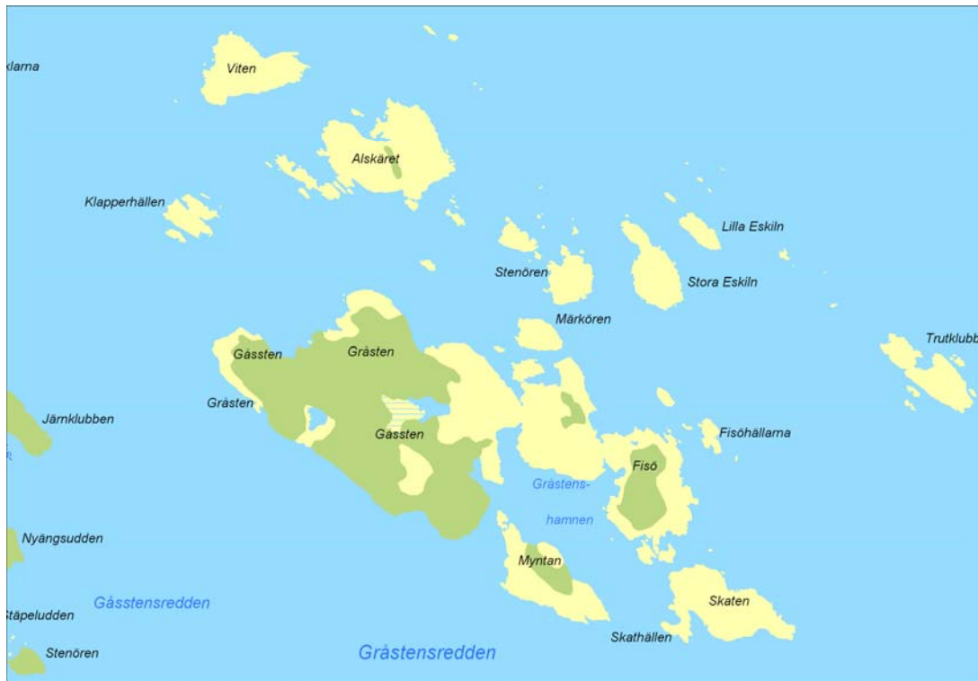
Figur 12. Gåsten, Alskäret och Viten ligger nära varandra en bit öster om Singö.